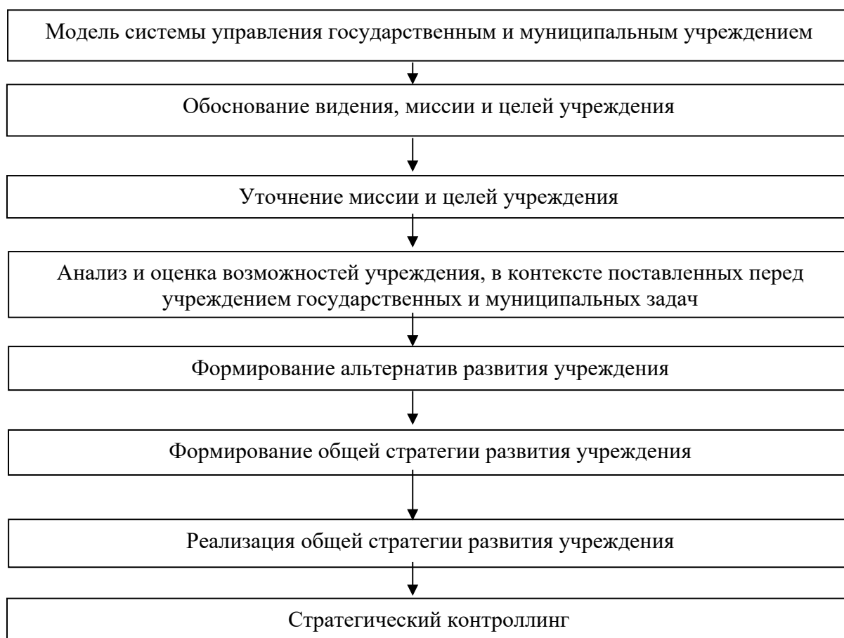
Рисунок 1 – Модель системы управления государственным и муниципальным учреждением

Корректное оформление графиков предполагает обязательные подписи осей координат, наличие легенды, в случае если это необходимо для чтения и понимания графика. Внутри графика его наименование не указывается.